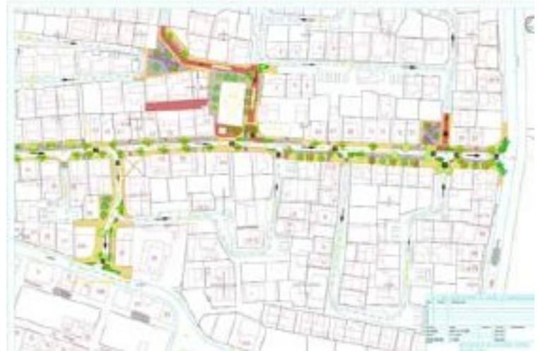
Village Phase 1B